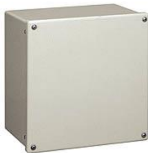
FRP300 × 300 × 200