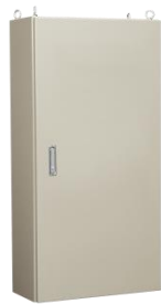
E35-814A-N-F 基台なし・鉄製基板なし