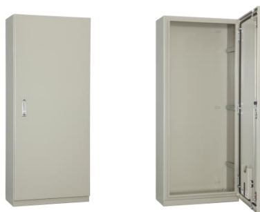
E35-716A-F 基台付・鉄製基板なし