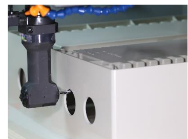
マシニング加工イメージ