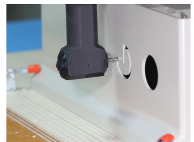
マシニング加工イメージ