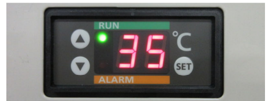
温度表示部 (運転、警報表示)