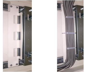
【電線支持金具外観】 【電線支持金具利用例】