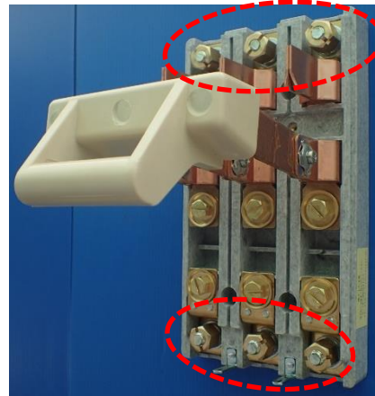
CKL3P150A 上・下カバーを開けた状態