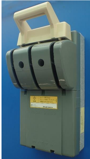
CKL3P150A カバーを閉じた状態