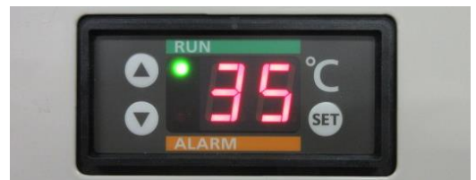
温度表示部 (運転、警報表示)