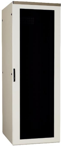
スタンダードタイプ 【FS】