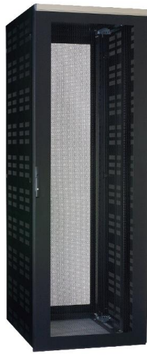
サーバ収納タイプ 【FSS】