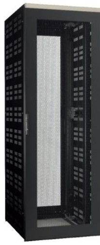
サーバ収納耐震タイプ 【FSST】