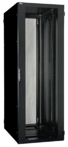
耐震ラック ガルテクト (W=700) 【FSG】