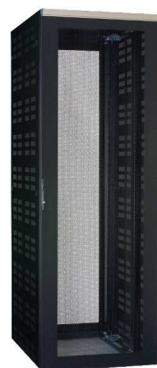
サーバ収納タイプ 【FSS】